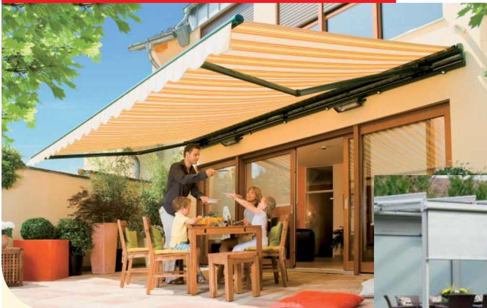
▲ weinor Markisen