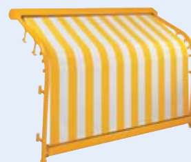
Bogenanlage WGM 2020 Design