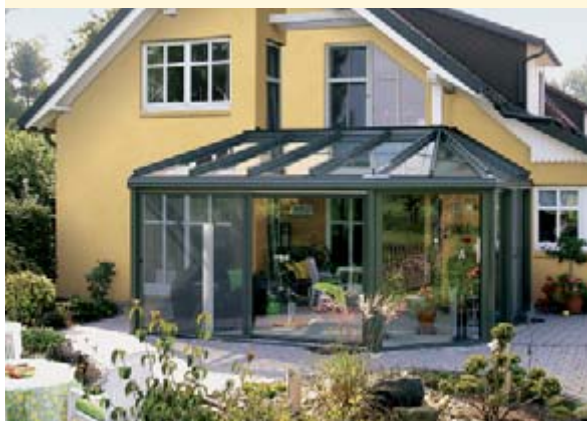
▲ weinor Wintergärten

Wie auch immer Sie Ihre Terrasse nutzen möchten, weinor hat das geeignete Produkt für Sie – Markisen, Terrassendächer und Wintergärten