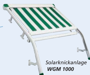
Solarknickanlage WGM 1000

Für größere Flächen können bis zu drei WGM 1000 und bis zu vier WGM 1030 nebeneinander montiert werden. Die Tücher fahren parallel ein und aus. Ab einer bestimmten Breite werden zwei durch einen Motor betriebene Einzelanlagen mit Hilfe eines Doppeltransportprofils verbunden.