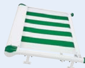
Flachanlage WGM 1030