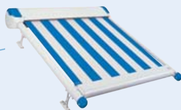
Flachanlage WGM 2030 Design

Alternativ können Sie eine WGM 2030 Design in Kombination mit der Fenster-Markise Aruba wählen. In diesem Fall werden Dachschräge und Seitenelemente unabhängig voneinander beschattet – natürlich ist beides mit der Fernbedienung zu steuern. Diese Lösung eignet sich besonders für kleinere Wintergärten.