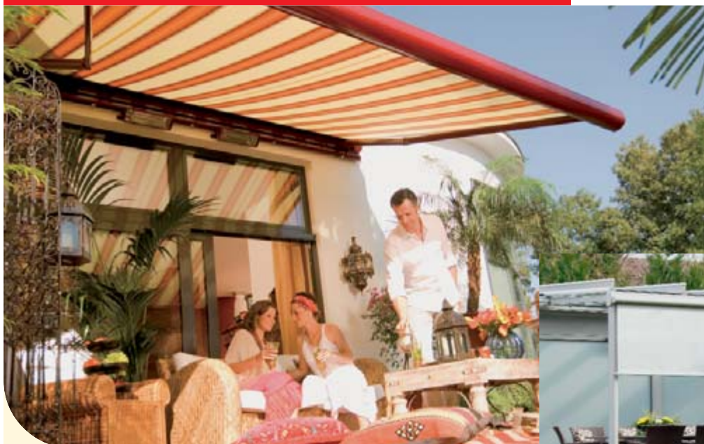
▲ weinor Markisen